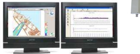
Centrale de surveillance, de monitoring et d'alerte